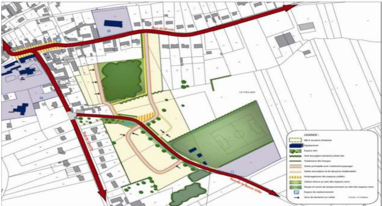
Schéma d'aménagement opposable :