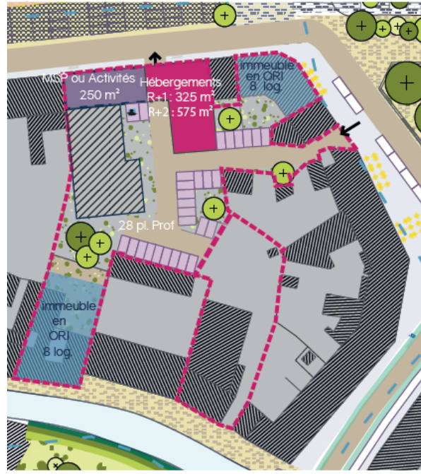
• Plan étage