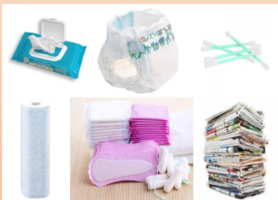
Produits non dégradables (couche bébé, lingettes nettoyantes, coton tiges, produits d'hygiène féminine, journaux, essuie-tout, etc...)