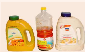
Graisse et huile ménagères