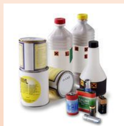
Produits chimiques (solvants, peintures, etc...)